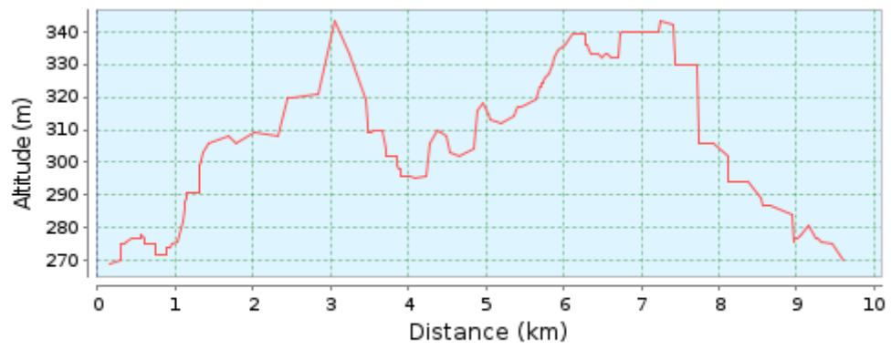
Höhenprofil (269 m bis 343 m)